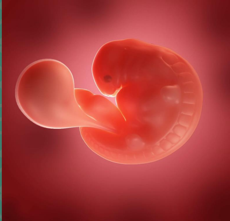
عمر جنین: سه هفته