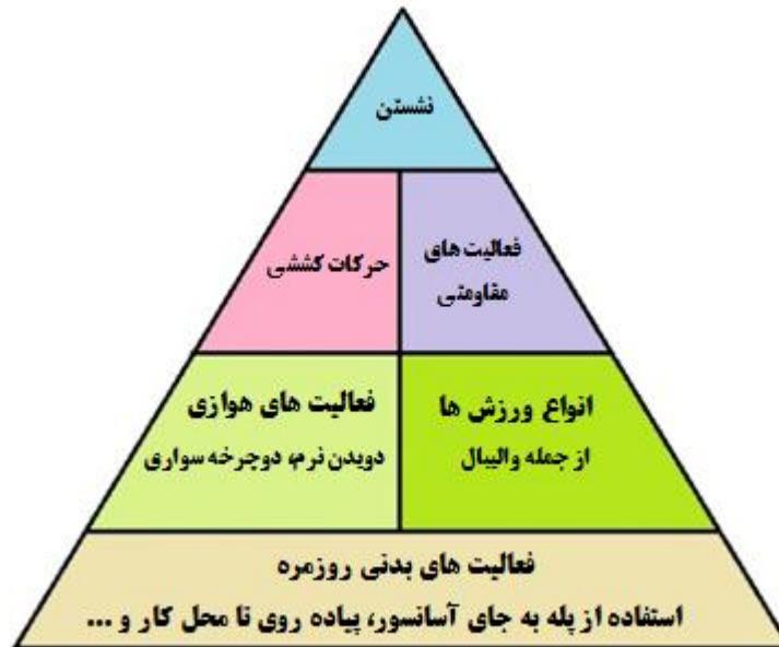
شکل ۱. هرم فعالیت بدنی

چند خیابان جلوتر و پیمودن قسمتی از مسیر به صورت پیاده، انجام کارهای باغچه و منزل را نام برد. در سطح دوم هرم، فعالیت‌های هوازی مانند پیاده‌روی سریع، دویدن، دوچرخه‌سواری، شنا، حرکات موزون هوازی و انواع ورزش‌ها قرار می‌گیرند. در سطح سوم هرم، حرکات کششی و فعالیت‌های مقاومتی قرار دارند. در قله هرم، فعالیت‌هایی قرار دارند که اگرچه فعالیت بدنی محسوب می‌شوند اما جزء فعالیت‌های کم تحرک محسوب می‌شوند به همین دلیل باید آنها را به کمترین میزان ممکن رساند. از جمله این فعالیت‌ها می‌توان تماشای تلویزیون، استفاده از موبایل و یا بازی‌های کامپیوتری را نام برد. این فعالیت‌ها علاوه بر افزایش خطر ابتلا به بیماری‌های مختلف جسمانی و روانی، موجب کاهش انعطاف‌پذیری مفاصل و قدرت و استقامت عضلانی و در نتیجه خطر آسیب دیدگی و دردهای اسکلتی عضلانی می‌شوند.