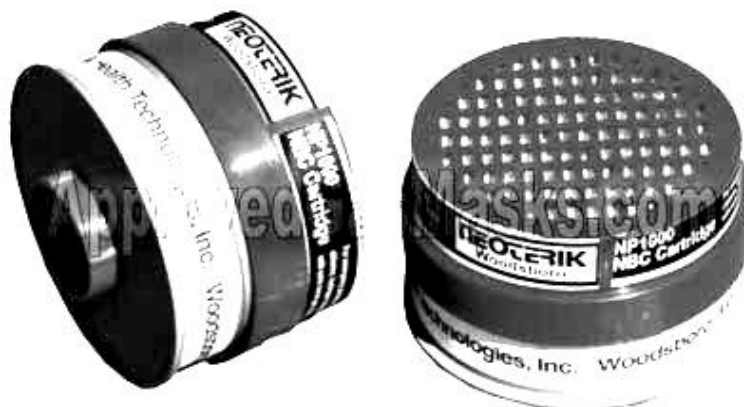
شکل ۳-۵: نمونه‌ای از فیلتر HEPA

به دلیل گران قیمت بودن آنها در سیستم‌های تهویه ساختمان‌ها مورد استفاده قرار نمی‌گیرد.