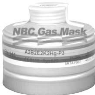
شکل ۳-۳: ساختمان ظاهری فیلتر یک ماسک NBC

۲- فیلتر تمرینی که به رنگ سفید موجود است و به منظور کاهش هوای تنفسی ورودی به ریه‌ها به کار برده می‌شود. این فیلتر در برابر عوامل زیستی و شیمیایی هیچ‌گونه کاربردی نداشته و فقط جهت تمرین و آموزش به کار برده می‌شود.