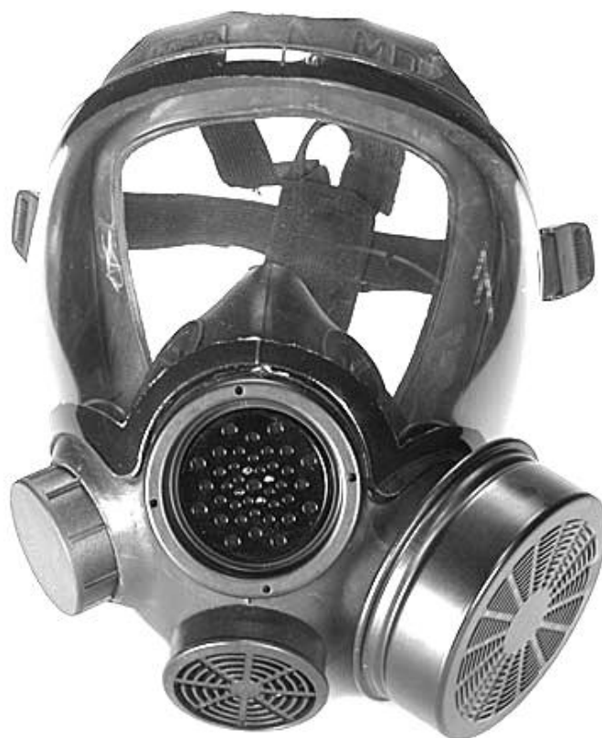
شکل ۳-۲: شکل ظاهری یک ماسک مخصوص تهدیدات زیستی

در هر ماسک، هوای تنفسی از طریق فیلتر آئروسول، فیلتر کربن و دریچه تنفس وارد فضای ماسک شده و استنشاق می‌شود. هوای بازدم نیز از ریه‌ها وارد ماسک شده و از طریق دریچه یک طرفه خروجی از ماسک خارج می‌شود. جهت راحتی و حداکثر تاثیر، این ماسک‌ها نباید بیش از شش اونس وزن داشته باشند.