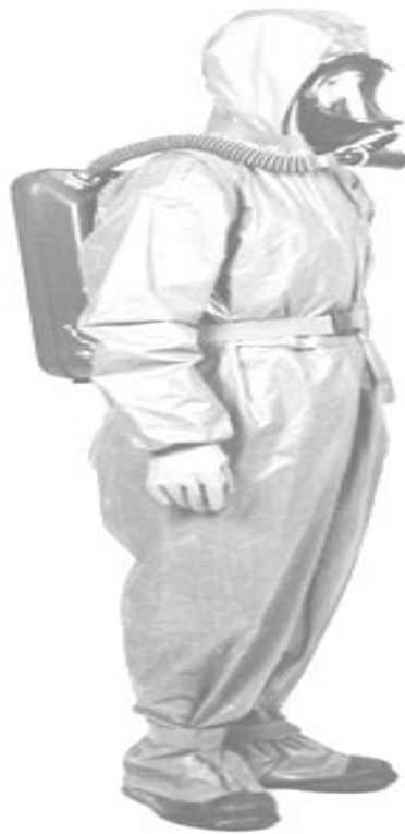
شکل ۳-۴: نمونه‌ای از لباس‌های محافظ یکپارچه موسوم به IIAP

یکی دیگر از تجهیزاتی که مانع از ورود عوامل زیستی به دستگاه تنفس می‌شود، لباس‌های محافظ می‌باشد که این لباس‌ها مخصوص جنگ‌افزارهای شیمیایی و میکروبی بوده و باعث حفاظت در مقابل عوامل میکروبی می‌گردند. در تولید این لباس‌ها که یکپارچه و سبک‌وزن می‌باشند از فناوری فوم ذغال فعال شده یا حباب ذغال فعال شده استفاده شده است. نمونه‌ای از لباس یکپارچه موسوم به IIAP به همراه تجهیزات تنفسی به کمک نوعی کوله پشتی در شکل ۳-۴ مشاهده می‌شود.