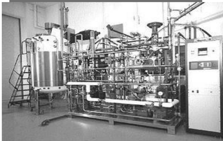
شکل ۶-۲: حفاظت از مخازن آب شرب و غیر شرب