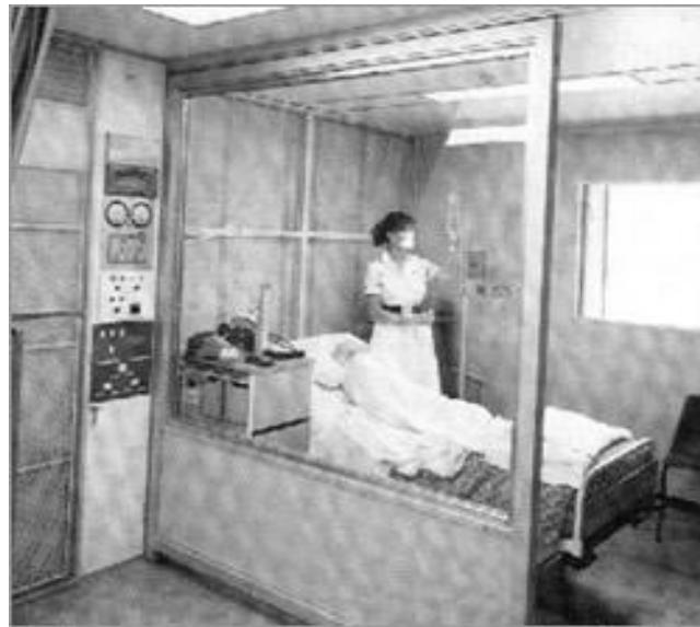
شکل ۶-۳: ایزولاسیون بیمار آلوده به عوامل زیستی

یکی از خصوصیات مهم عوامل بیولوژیک، مسری بودن آن‌هاست. به عبارت دیگر، عوامل زیستی پس از آنکه در یک منطقه انتشار داده شوند به‌خودی خود و با انتقال مستقیم، افراد مختلف را آلوده می‌کنند. با این اوضاع، ایزولاسیون بیماران ناشی از عوامل زیستی مهم و بسیار ضروری است. هرگونه همه‌گیری ناشی از عوامل زیستی در مدت کمی عملاً از کنترل خارج خواهد شد، بخش بیولوژی باید چگونگی و نحوه ایزولاسیون بیماران و مصدومین ناشی از تک بیولوژیک را بررسی و تدوین کند. سوالاتی نظیر: چرا باید ایزولاسیون بیماران صورت گیرد، شرایط ایزولاسیون بیماران چیست و ظرفیت تخت‌های بیمارستانی ایزوله چقدر است، باید جواب کاربردی داشته باشند.