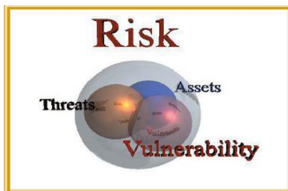
شکل ۶-۱: تاثیر مولفه‌های تهدید و آسیب‌پذیری بر ریسک‌پذیری

اگرچه ترکیب احتمال تهدید و آسیب‌پذیری است که تاثیر را افزایش می‌دهد ولی میزان آسیب‌پذیری بستگی دارد به وقوع حادثه و میزان تاثیر آن. بنابراین، افزایش دو مولفه اصلی تهدید و آسیب‌پذیری سبب افزایش جدی ریسک‌پذیری در مقایسه با مجموعه‌هایی با میزان کم یا متوسط دو مولفه اصلی تهدید و آسیب‌پذیری هستند که دارای ریسک پایین و متوسط می‌باشند و در صورتی می‌توان میزان ریسک یک مجموعه را به صفر رساند که حداقل یکی از این دو مولفه مهم صفر گردد.