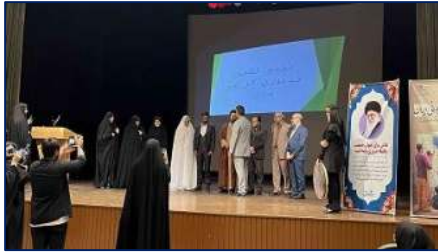
اولین رویداد شهرستانی خانواده، فرزند آوری و جوانی جمعیت در شهرستان دامغان برگزار شد ۱۴۰۳/۰۳/۲۶