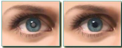
چشم معمولی آب مروارید چشم